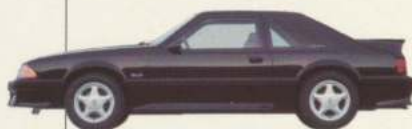
Le hatchback 2 portières Mustang Cobra GT

L'énorme succès remporté par la Mustang au cours des années n'a jamais été un mystère pour personne. C'est une voiture qu'on prend plaisir à conduire et d'une grande valeur pour son prix. Avec la Mustang, vous avez tout le loisir de choisir une voiture avec un niveau de performance à la hauteur de vos attentes. Vous pouvez obtenir le V8 aux performances époustouflantes dans les séries Cobra GT ou LX 5 L (sans autre condition que savoir apprécier tous les attraits de la conduite sportive), ou vous pouvez choisir la Mustang LX, à la fois attrayante et économique à l'usage. Peu importe la série, vous obtiendrez toujours le style sport et l'allure jeune qui ont fait la réputation de la marque Mustang et ce, depuis son mémorable lancement il y a