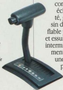
Les deux moteurs Mustang peuvent être combinés, en option, à une boîte automatique à surmultipliée afin d'augmenter au maximum la facilité de conduite.

La liste des équipements de série de la Mustang offre toutes sortes de possibilités attrayantes. À ce sujet, concilier le prix de la voiture avec son équipement procure une agréable surprise. Cet équipement comprend notamment : deux rétroviseurs extérieurs à télécommande, groupe complet d'instruments (incluant