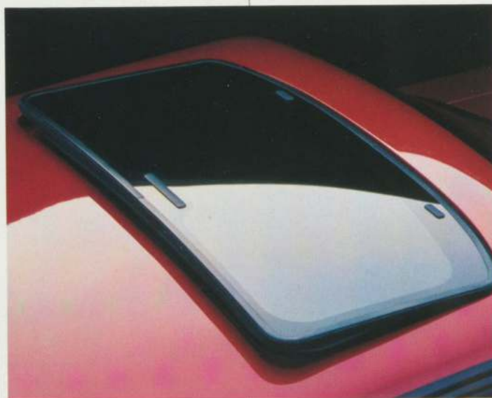
Le toit ouvrant à panneau amovible, en option dans le hatchback, se manoeuvre facilement pour améliorer la ventilation.

compte-tours), groupe éclairage de commodité, glaces teintées, coussin de sécurité à sac gonflable pour le conducteur et essuie-glace à balayage intermittent. Cet équipement représente vraiment une valeur considérable pour son prix, et les groupes d'équipements préférés sont encore plus avantageux car ils offrent des rabais sur des ensembles d'options par rapport aux prix des mêmes équipements achetés séparément.