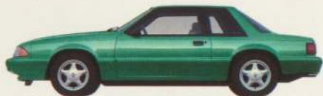
Berline 2 portières Mustang LX 5 L