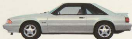
Hatchback Mustang LX 5 L