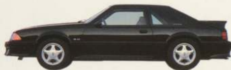
Hatchback 2 portières Mustang GT

Bien sûr, ce n'est pas tout, car les caractéris-