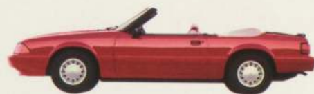
Cabriolet Mustang LX