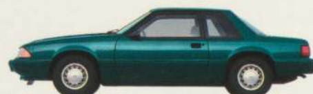
Berline 2 portières Mustang LX

tiques de série de la Mustang LX (page 7) comprennent aussi : direction assistée, freins assistés à disque avant/tambour arrière, jambes avant et amortisseurs arrière hydrauliques à azote sous pression, ainsi qu'un coussin de sécurité gonflable côté conducteur (à utiliser avec les ceintures).