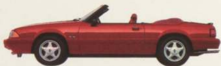
Cabriolet Mustang LX 5 L