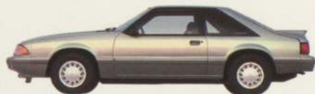
Hatchback 2 portières Mustang LX