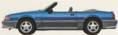
Cabriolet Mustang GT